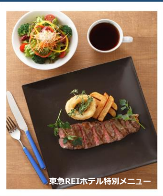
東急REIホテル特別メニュー